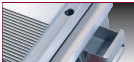
Tiroir de récupération des graisses.